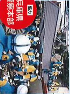
【協力】 兵庫県 警察本部