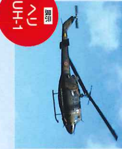
【協力】 へい UH-1