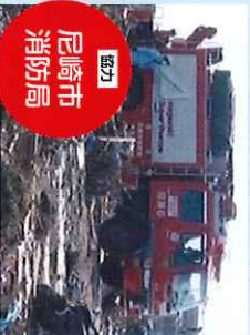
【協力】 尼崎市 消防局