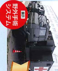
【協力】 野外手術 システム