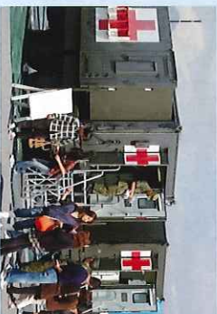
▲野外手術システム